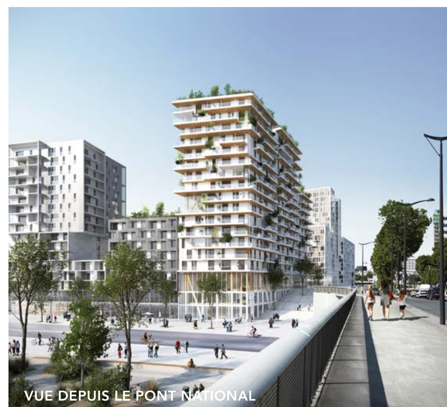
VUE DEPUIS LE PONT NATIONAL

Groupe Pichet Atelier Pascal Gontier Urban Act Wagon Charpente Concept Izuba energie AIDA acoustique Simonin Simonetti Eric Michel C-Développement GNC La conciergerie solidaire