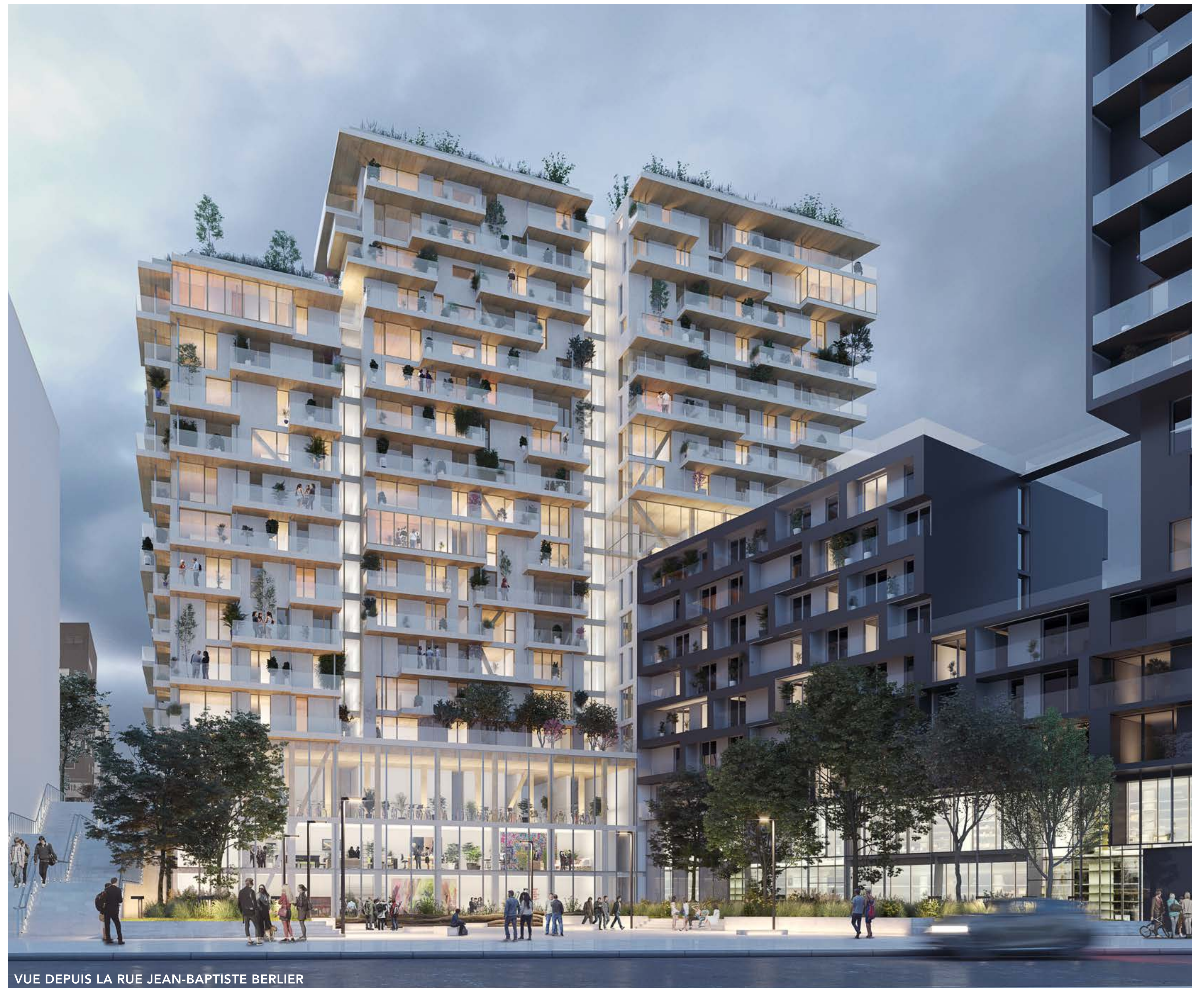
VUE DEPUIS LA RUE JEAN-BAPTISTE BERLIER