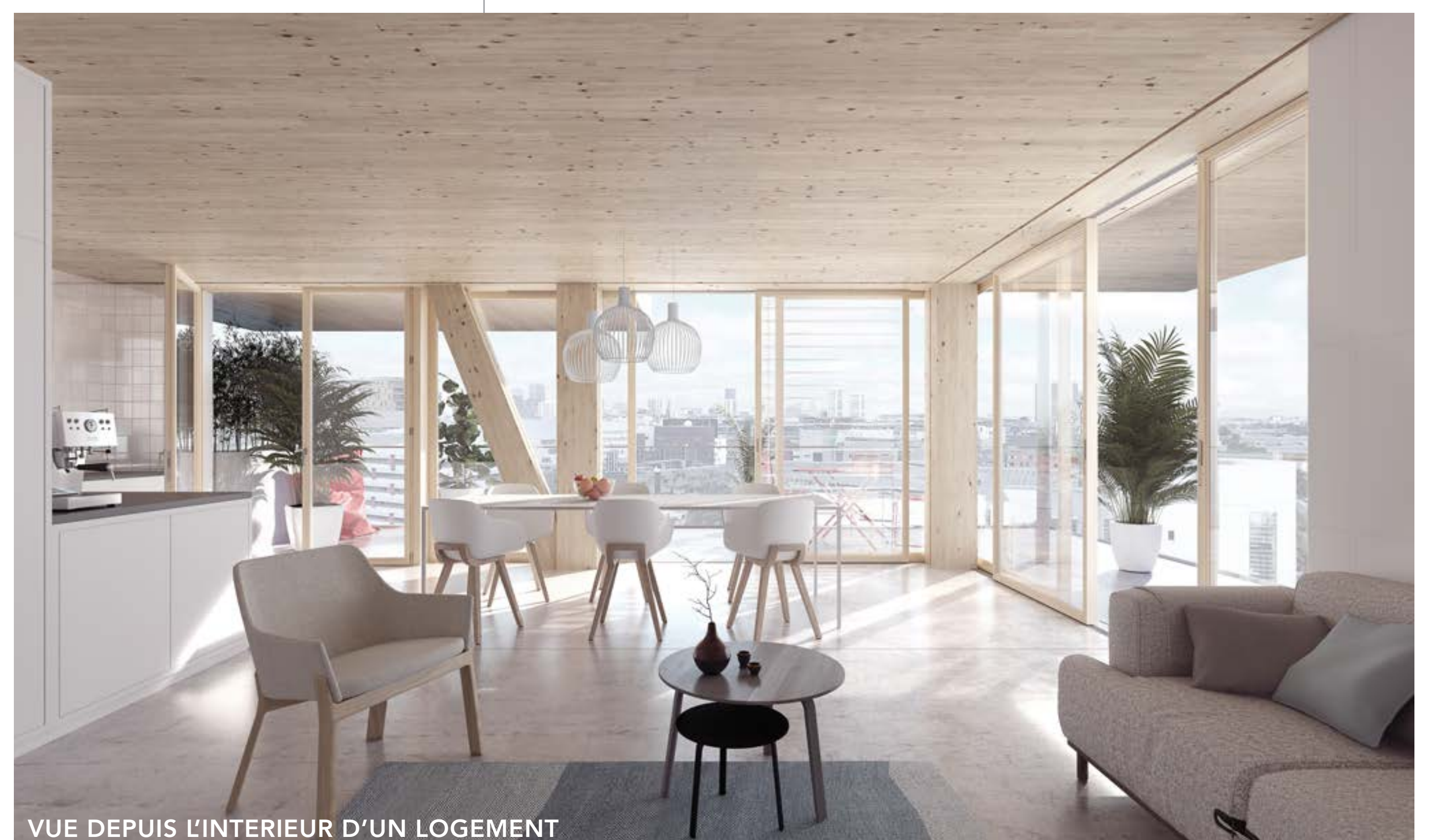
VUE DEPUIS L'INTERIEUR D'UN LOGEMENT