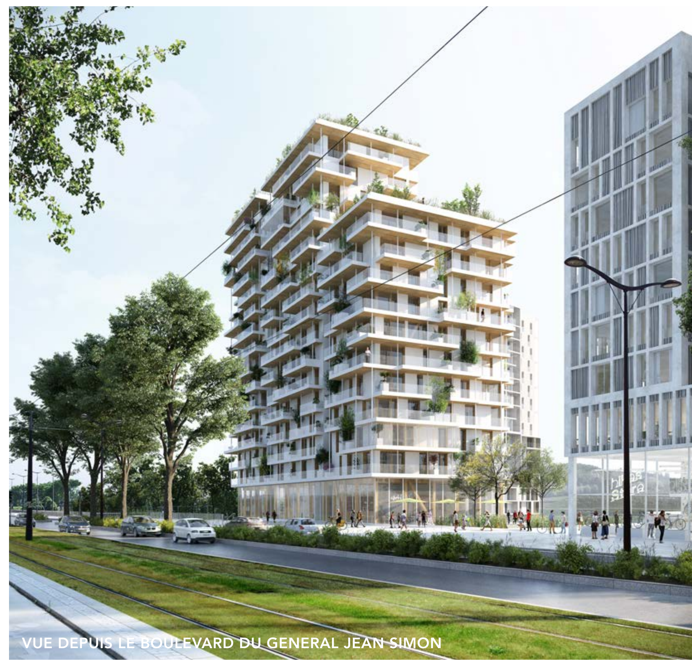
VUE DEPUIS LE BOULEVARD DU GENERAL JEAN-SIMON